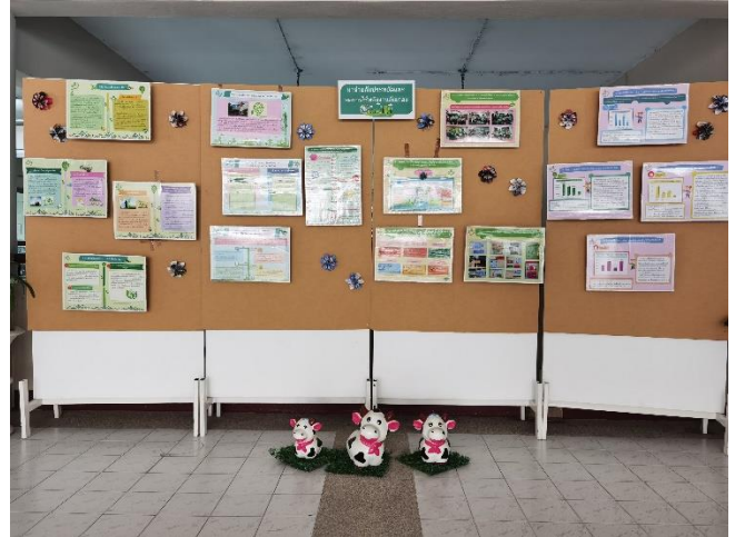
ภาพการจัดแสดงนิทรรศการที่เป็นมิตรกับสิ่งแวดล้อม การจัดการขยะและน้ำเสีย