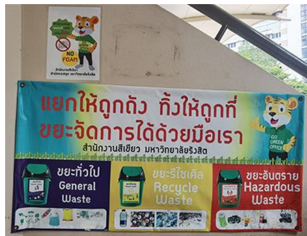
ภาพป้ายรณรงค์การแยกขยะทิ้งให้ถูกประเภท