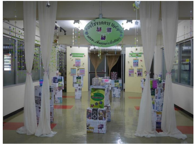
ภาพการจัดแสดงนิทรรศการประดิษฐ์สิ่งของจากวัสดุเหลือใช้และการนำขยะกลับมาใช้ใหม่