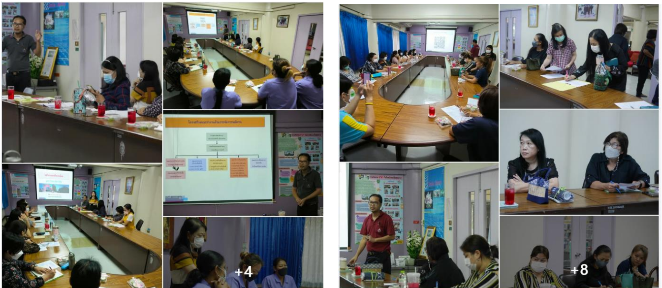
ภาพการอบรมให้ความรู้เรื่องการอนุรักษ์พลังงาน