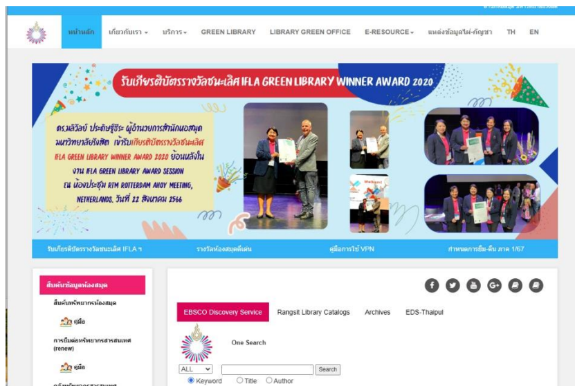
ภาพเว็บไซต์สำนักหอสมุด

เว็บไซต์ (Website) สำนักหอสมุด เป็นแหล่งประชาสัมพันธ์และเผยแพร่ข้อมูลการอนุรักษ์พลังงานและสิ่งแวดล้อมถึงบุคลากรและผู้ใช้บริการห้องสมุดที่สามารถเข้าถึงตลอดเวลาที่ URL: https://library.rsu.ac.th/