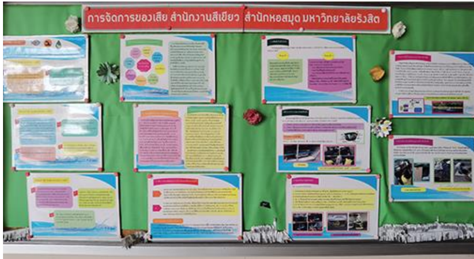
ภาพบอร์ดให้ความรู้การจัดการของเสีย